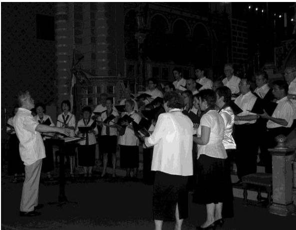
A Pécsi Székesegyház Palestrina Kórusa 2011. július 10-én

Köszönjük mindazok segítségét, akik bármivel hozzájárultak ahhoz, hogy a CD és a lemezbemutató koncert létrejöhetett.