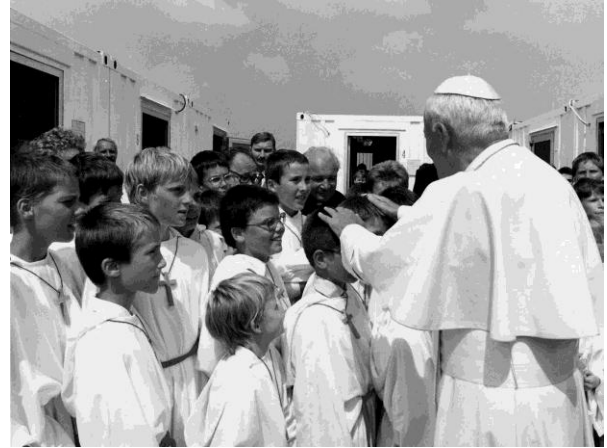
Az énekkortatások II. János Pál pápával 1991. augusztus 17-én

A sok jó mellett biztosan sok rosszat is el lehet mondani a Püspöki Énekiskoláról. Néhány régi énekkortatás is kritikával fordult az új fiúk felé: a teljesen más körülmények között létrejött, a régítől gyökeresen eltérő rendszerű intézménytől ugyanazt az eredményt várták, mint a korábitól, ráadásul azonnal. Való igaz, hogy a Püspöki Énekiskola nem szorította ki a Palestrina Kórus női szolamait a heti szolgálatból, és a gyermekkar nem énekelt évi 30 misekompozíciót – mégis a régi alapokon álló kórus volt, amelyben volt perspektíva, amely az egyházmegye ezeréves jubileumára és az EKF évére beérett volna. Ahogy karnagyunk, Jobbágy Valér mondta egy két évvel ezelőtti interjú során: „Nem hiszem, hogy akiknek útjában állt, azok valaha is fel tudnák mérni, hogy mit csináltak.”